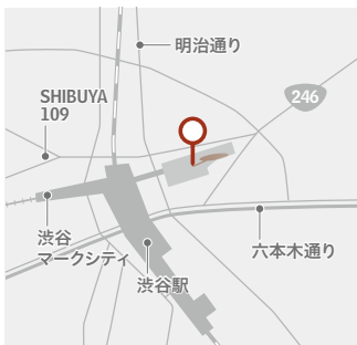
Shibuya Hikarie ACCESS MAP

〒150-8510渋谷区渋谷2-21-1 渋谷ヒカリエ 8階「8/ハチ」 東京メトロ副都心線、半蔵門線、東急東横線、東急田園都市線と15番出口直結。 JR山手線、東京メトロ銀座線、京王井の頭線と2F連絡通路で直結。