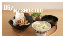
06/d47 SHOKUDO D&DEPARTMENT が運営するカフェレストラン。