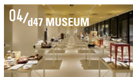
04/d47 MUSEUM D&DEPARTMENT による 47 都道府県をテーマとしたミュージアム。