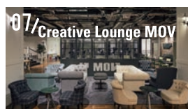
07/Creative Lounge MOV 渋谷らしい働き方を実践するメンバー制ワークスペース。