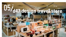
05/d47 design travel store d47 食堂や COURT でのイベントとも連動するショップ。