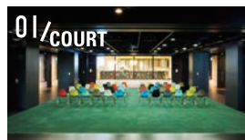
01/COURT グリーンカーペットが印象的な気持ちのよい空間のイベントスペース。

日本を代表するクリエイティブの拠点を目指して渋谷ヒカリエの8階に誕生したクリエイティブスペース「8」。多目的スペース(COURT)を中心に、強い意志を持つキーパーソンたちが集まって、ショップやギャラリー、シェアオフィス、カフェを運営しています。