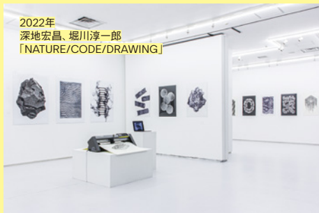
2022年 深地宏昌、堀川淳一郎 「NATURE/CODE/DRAWING」