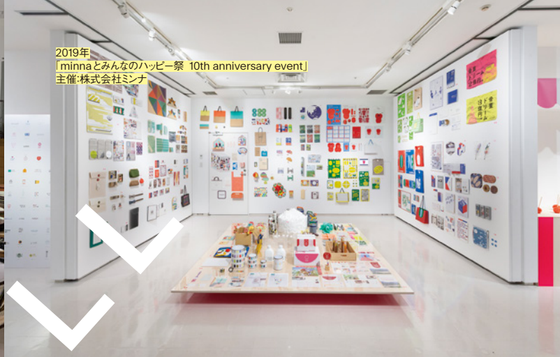
2019年 「minnaとみんなのハッピー祭 10th anniversary event」 主催:株式会社ミンナ