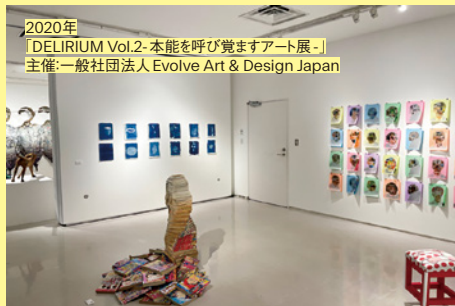
2020年 「DELIRIUM Vol.2- 本能を呼び覚ますアート展-」 主催「一般社団法人 Evolve Art & Design Japan」