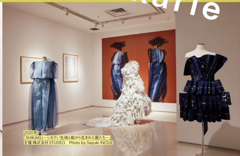
2020年 「SHIKAKUーシカクイ生地と絵から生まれた服たちー」 主催:株式会社STUDEO