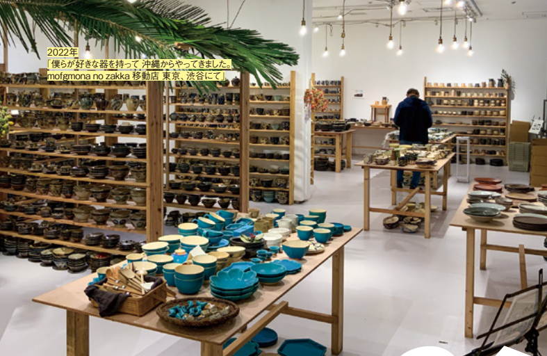
2022年 「僕らが好きな器を持って 沖縄からやってきました」 mofemona no zakka 移動店 東京、渋谷にて