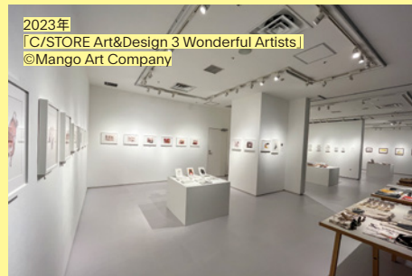
2023年 「C/STORE Art&Design 3 Wonderful Artists」