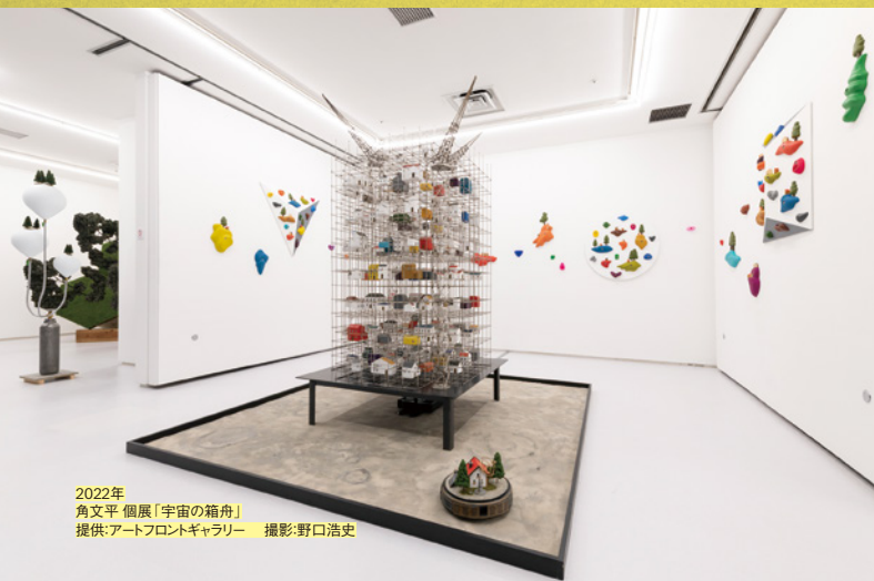
2022年 角文平 個展「宇宙の箱舟」

2024年4月～2025年3月に、 渋谷ヒカリエ8階CUBEで行う展覧会を公募！ 応募締切：2023年10月31日[火] 必着