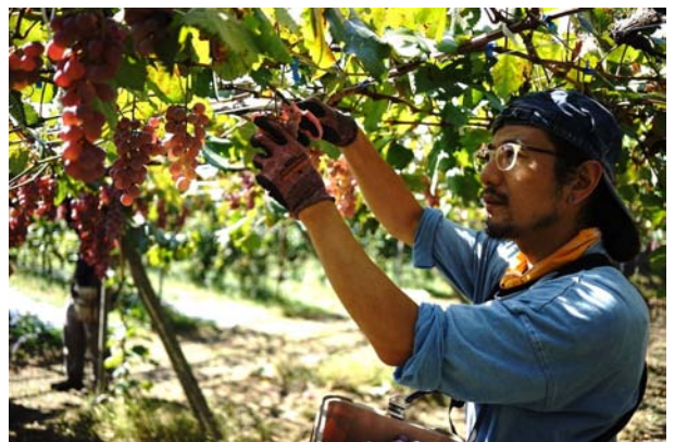
山梨県峡東地区：甲州ワイン