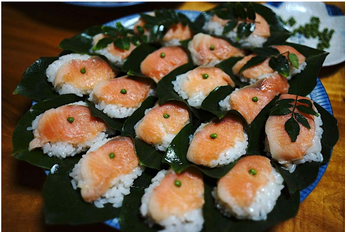
鳥取県智頭町：柿の葉寿司