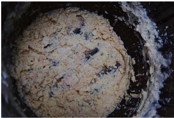
岐阜県長良川流域：鮎のなれずし