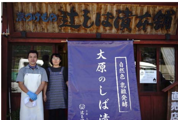
京都府京都市大原：しぼ漬