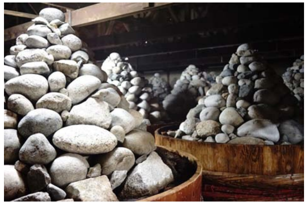
愛知県岡崎八帖地区：八丁味噌